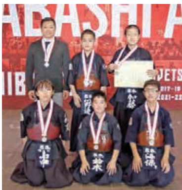
準優勝 君津・木更津