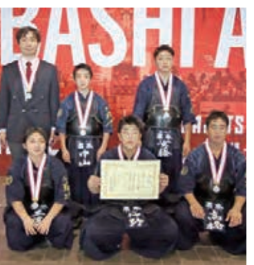
準優勝 君津・木更津