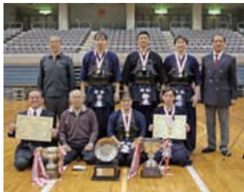
優勝 君津・木更津