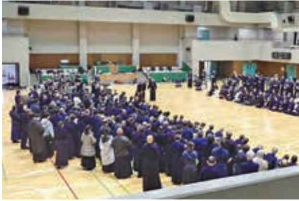
第39回 杖道中央・地区講習会の様子(2026年1月) 江戸川区スポーツセンターにて

審査会 八月十五日(金) 講習会 八月十六日(土)～十七日(日) 会場 Yohasアリーナ (千葉公園総合体育館)